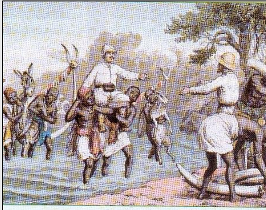
Encuentro entre comerciantes europeos y aborígenes africanos, fines del siglo XIX.