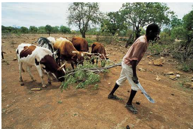
♦ Ganadería en África:

Teniendo en cuenta las preguntas que acabamos de proponer y muchas otras que pueden surgir de la observación, te pedimos que enumeres posibles preguntas a hacer sobre las cuatro fotos que te presentamos: