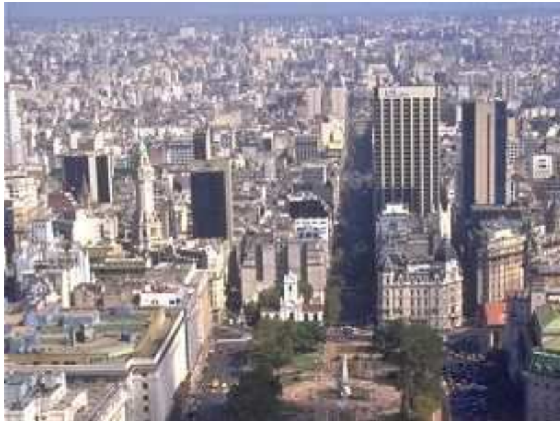
Plaza de Mayo - Cabildo de la Ciudad de Buenos Aires – vista actual

Si bien pertenecen al mismo lugar, hay grandes cambios. Entonces, anotá a continuación: