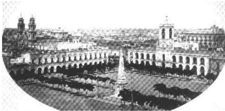
Plaza de Mayo - Cabildo de la Ciudad de Buenos Aires – año 1867

Ahora te pedimos que observes las siguientes imágenes: